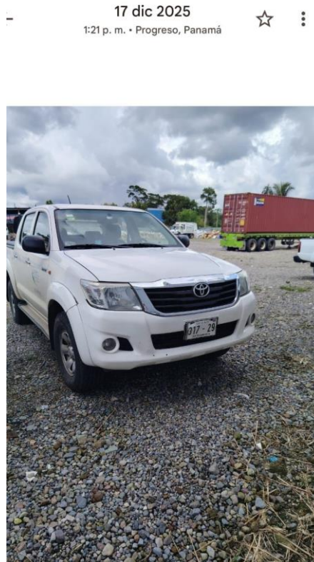
Formulario de denuncia 44Vgalo

Esta Auditoría Interna ha recibido una denuncia relacionada con presuntas irregularidades derivadas del uso de un vehículo de uso administrativo institucional rotulado en parqueo en la frontera con Panamá en horario y día laboral, (El 17 de diciembre a la 1:21 p.m. tal y como lo evidencia la foto que se adjunta, se observó un vehículo institucional del INAMU, con rotulación, en un parqueo en la frontera con Panamá. Lo que llama la atención por el lugar, el día y la hora en la que se ubicó este vehículo en un lugar que se utiliza para realizar compras)