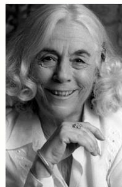
Carmen Martín Gaité

"No hay nada que se pueda comparar a la palabra y a la comunicación. No hay nada comparable a poder hablar a la persona adecuada en el momento adecuado en el que la persona a quien se habla tiene ganas de escuchar, y la persona que habla desea hablar".