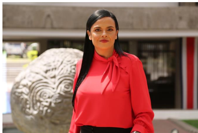
Marcela Guerrero Campos Presidenta Ejecutiva INAMU

Tengamos a las mujeres de este país como nuestro principal foco de atención, ellas están por encima de nuestra tarea y la mejor manera de honrar esos 200 años de independencia, es dirigir nuestro trabajo para que las mujeres sientan el respaldo de una institución que vela por sus derechos.