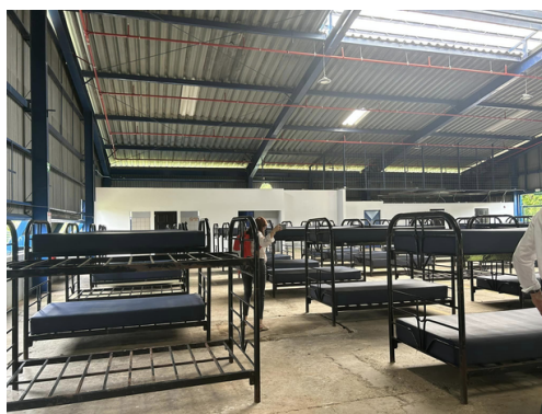
Flujo migratorio en la frontera Sur