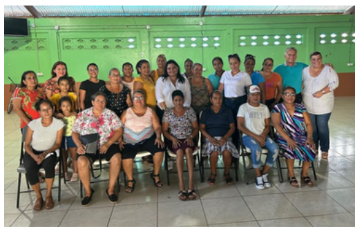
Bebedero de Cañas

El objetivo de las giras es conocer -de primera mano- las necesidades y desafíos a los que se enfrentan día con día las mujeres, así como la falta de oportunidades para poder desarrollarse y salir adelante con sus hijas e hijos.