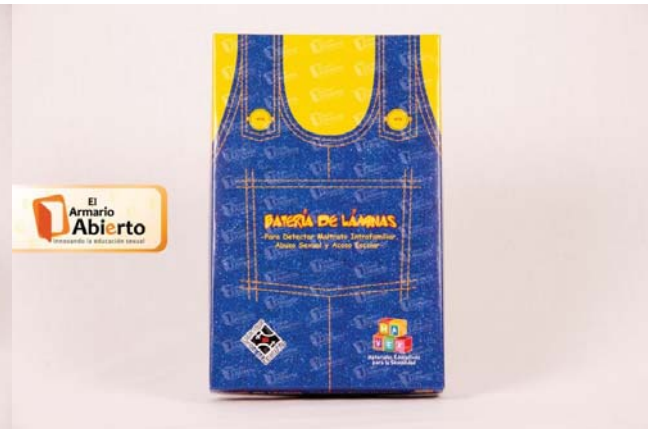
Batería de láminas. –Para detectar Violencia Sexual e Intrafamiliar–