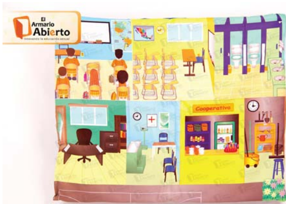
Tablero interactivo novedoso para el trabajo del bullying y situaciones del mundo interno e interacciones relacionadas con el ámbito escolar.